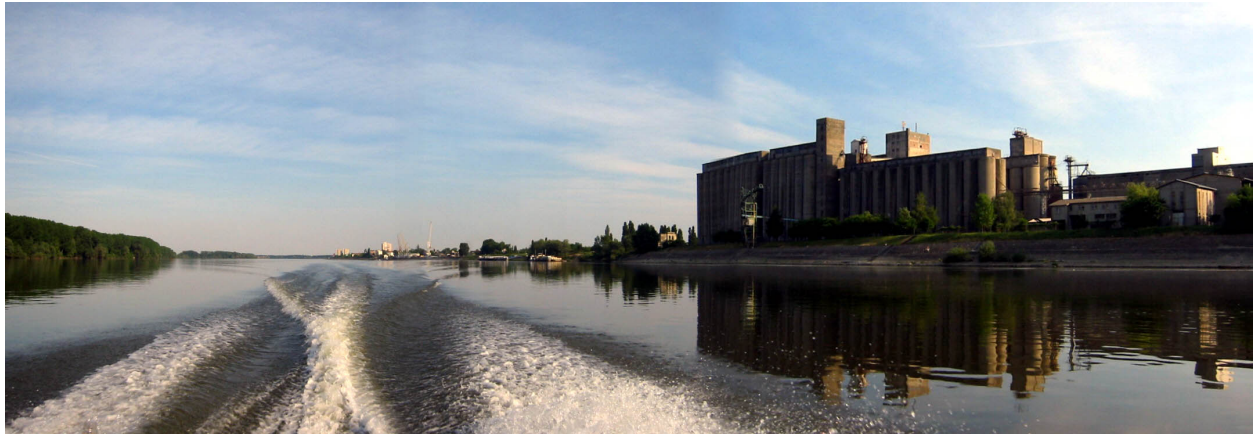
GOSPODARSKA ZONA NA OBALI RIJEKE

Najznačajniji razvoj turizma se očekuje u zoni uz Vučedol. Za tu namjenu je predviđeno posebno turističko, a posebno rekreacijska zona.