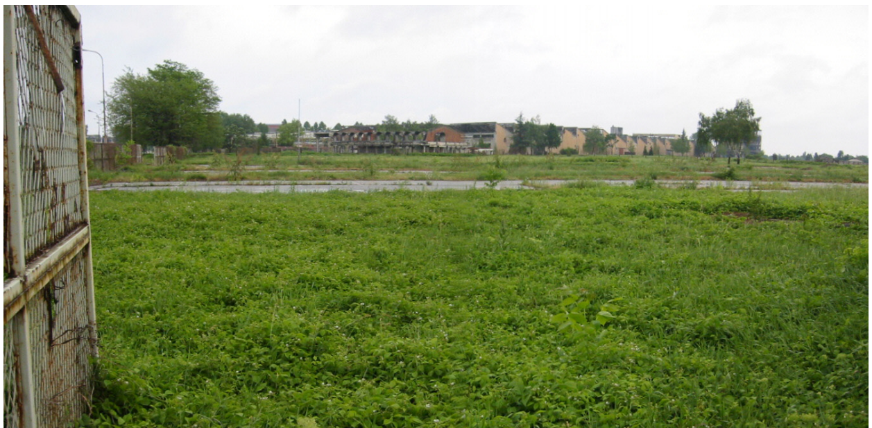
POGLED NA NEKADAŠNJI KOMBINAT BOROVO