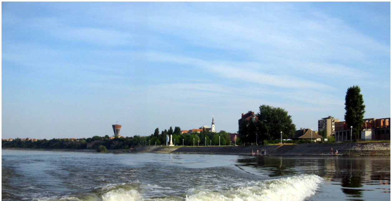
POGLED NA GRAD S DUNAVA

U većini ovih objekata bile su smještene državne i javne institucije, jedinice lokalne uprave i samouprave, gradska poduzeća, zdravstvene ustanove, pravosudni i drugi uredi od javnog interesa, udruge i sl. Budući da je većina objekata uništena ili oštećena, ovi uredi uglavnom posluju u neadekvatnom smještaju, iznajmljenom prostoru, ili su privremeno dislocirani izvan Vukovara, što predstavlja veliku prepreku normalizaciji života u Vukovaru.