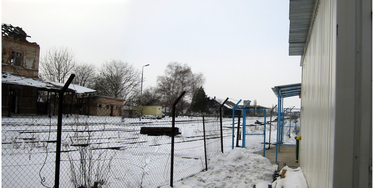
ZONA ŽELJEZNIČKOG KOLODVORA