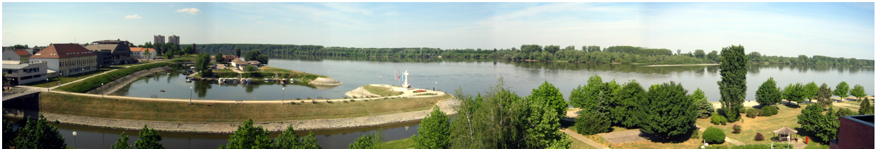
UŠĆE VUKE U DUNAV

Vukovarski ravnjak humoviti je teren s visinama 95-111 m n.m. Morfološke osobine bliže su nizinskom nego brdskom terenu, slabo izraženog reljefa s nekoliko dublje usječenih dolina – prapornih surduka kojima protječu vodotoci Dola, Crepov Dol, Bogdanovački Savak, Kervež i Henrikovac. Dva od njih teku prostorom Grada, Dola cijelim tokom, a Bogdanovački Savak gornjim dijelom toka. Vodotoci imaju stalnu protoku koja je posljedica veoma izdašnih izvora karakterističnih za područja pod naslagama prapora. Opsežniji radovi na ovim vodotocima, osim čišćenja korita neposredno prije ušća u Vuku, nisu provedeni.