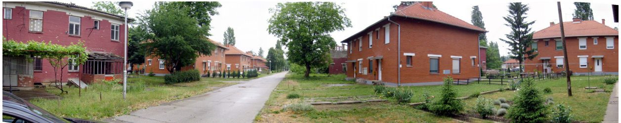
VRIJEDAN AMBIJENT BOROVA NASELJA IZ PRVE POLOVINE 20 st.