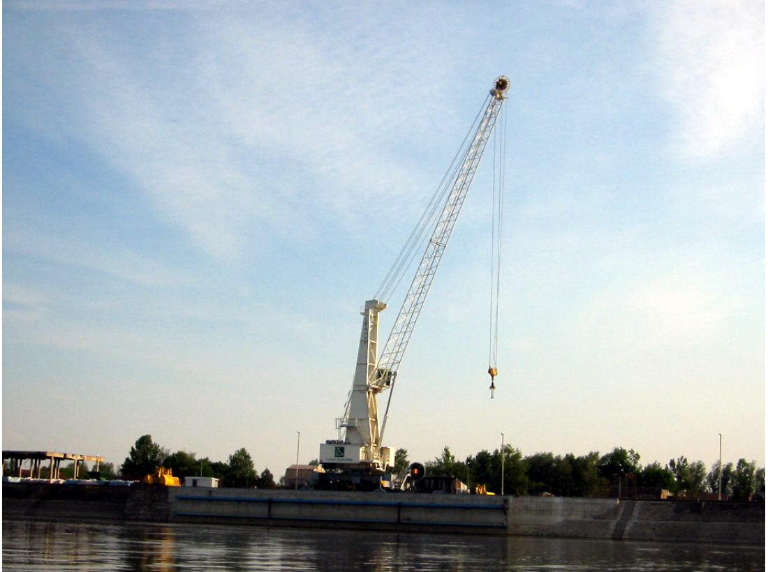
DIZALICA U LUCI