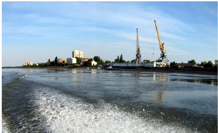
POGLED NA VUKOVARSKU LUKU

Godine 1991. 19 su određene dvije lokacije lučkog područja i dva sidrišta. Taj prostor Lučka uprava sve intenzivnije koristi i oprema.