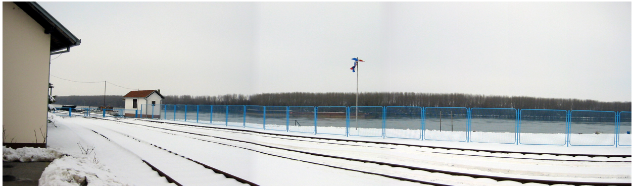
ŽELJEZNIČKA INFRASTRUKTURA LUKE VUKOVAR

Sanirano je zatvoreno skladište, ali površinom ( P = 2500 \text{ m}^2 ) ne zadovoljava iskazane potrebe za zatvorenim skladišnim prostorom. Izgrađen je terminal za rasute terete (žitarice, uljarice, umjetno gnojivo) kapaciteta 120 t/sat i separacija šljunka kapaciteta 39 \text{ m}^3 . Izvršeni su popravci operativnih površina, industrijskih željezničkih kolosijeka (oko 3,0 km). Osigurano je rezervno napajanje elektroenergetskog postrojenja. Izgrađena je nova vertikalna obala dužine 50 m i drugo.