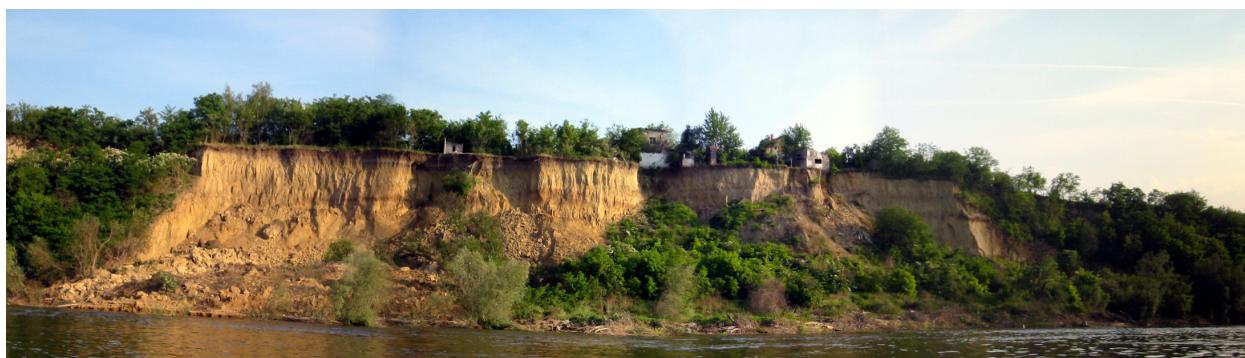
STRME OBALE RIJEKE

Đergaj i Mala Ada ne predlažu se štititi planom kao posebne vrijednosti.