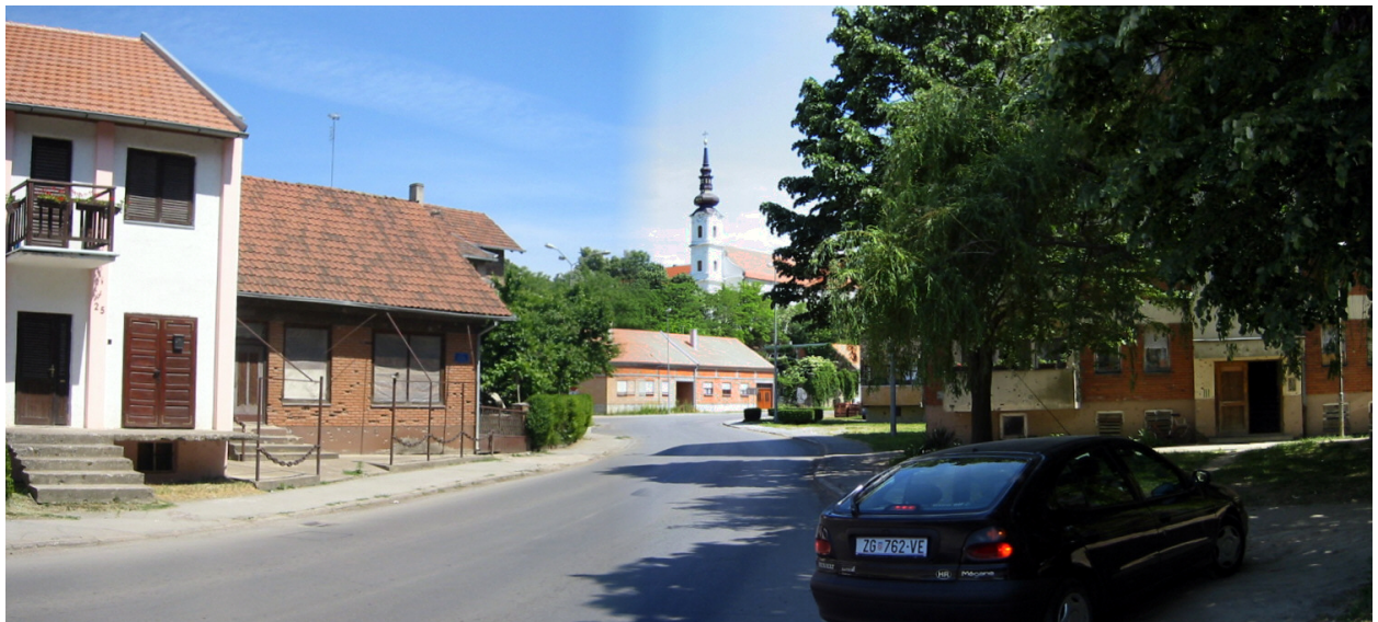
VUKOVAR – križanje Radićeve i Andrićeve