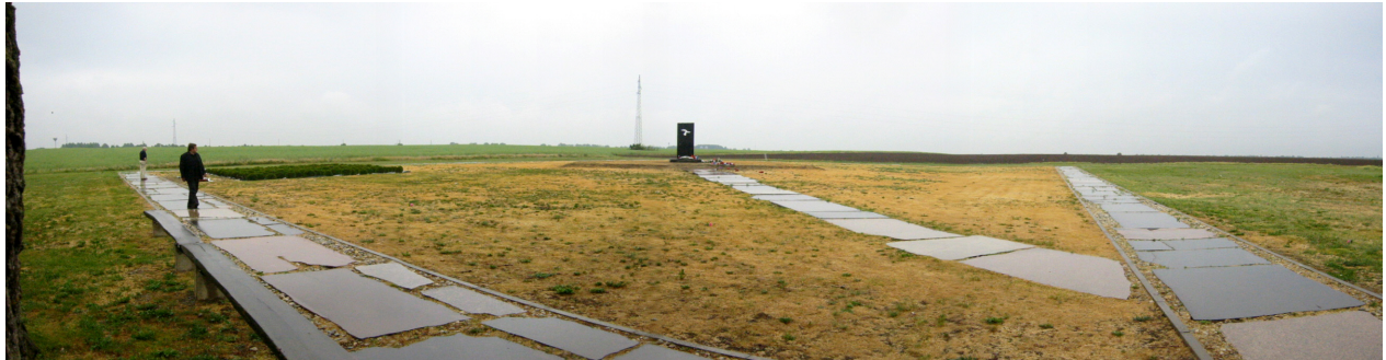
OVČARA – SPOMENIK BRANITELJIMA