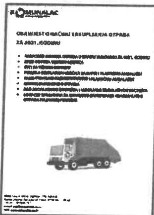
Slika 2. Obavijest o načinu sakupljanja komunalnog otpada u 2021. godini – Grad Vukovar

Kako bi korisnike pravovremeno informirali o promjenama te im pružili i ostale korisne informacije o načinima i uvjetima postupanja s otpadom na području grada Vukovara i ove godine je dostavljeno na kućne adrese korisnika usluge oko 10.500 komada Obavijesti o načinu sakupljanja komunalnog otpada u 2021. godini – Grad Vukovar (Slika 2.) te su korisnicima u individualnim kućanstvima podijeljene vrećice za papir i plastiku. Na kraju 2020. godine broj korisnika u kućama iznosio je oko 6.400, a broj korisnika u zgradama je bio oko 4000.